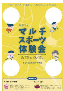
スタンプラリー用台紙