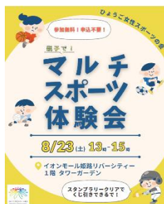
館内用チラシ (イオンモールアプリ)